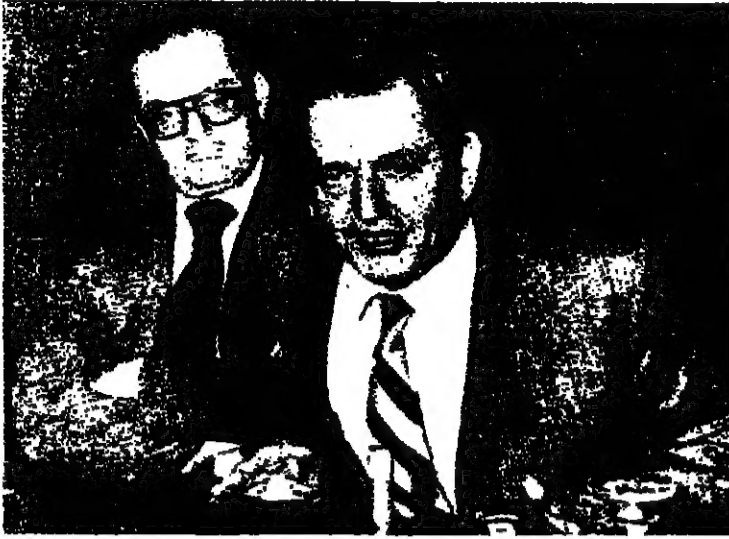
المبعوث الدولي اولوف بالمباي عقد مؤتمرا صحفيا في جنيف في طريقه الى طهران

طهران - بغداد - الوكالات - قال أمس السيد اولوف بالمباي رئيس وزراء السويد السابق ومبعوث السكرتير العام للأمم المتحدة للتكوير كورت فالدهايم، إلى كل من العراق وايران أنه جاء السير طهران للوقوف عن كعب على موقف المسؤولين الإيرانيين من إمكانية تسوية النزاع القائم مع العراق بالطرق السلمية - وأضاف السيد بالمباي أن المهمة التي كلفها صعبة للغاية غير أن احتمالات نجاحها جيدة وسيتولى وأوضح أنه سيتوجه بعد يومين إلى بغداد لتس الفرص - وأكد المبعوث السويدي للصينيين في العاصمة الإيرانية أنه في بحث في موضوع الرهائن الأميركيين المحتجزين في ايران، وفكر أن السيد بالمباي سيتوجه صباح اليوم مع الرئيس الإيراني أبو الحسن بن صدر - وتأتي زيارة السيد بالمباي لطهران في الوقت الذي أعلن فيه القوات الإيرانية من احتياطها محاولة العراق احتلال مدينة سوسنغرد الواقعة في إقليم خوزستان - وأعلن راديو طهران أن القوات الإيرانية صحت القوات العراقية وأنها على انسحاب من المنطقة - وأضاف الراديو أن مللت الجيش منشرة في شوارع المدينة اثر الاشتباكات التي استمرت اربعة ايام - واتهم راديو طهران القوات العراقية باستخدامها اسلحة كيميائية وقابل حركة خلال محاولتها احتلال سوسنغرد - البنية على س ٧٤٨